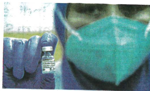
VAKSIN Covid-19 Comirnaty keluaran Pfizer yang diberikan kepada rakyat negara ini. – GAMBAR HIASAN

"Bagaimanapun, ujian RTK-Ag yang dijalankan ke atas pengembara tersebut adalah negatif. Tada pengembara dari China yang dikesan positif Covid-19 di pintu masuk antarabangsa negara setakat ini," katanya.