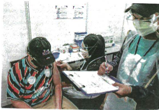
KESEDARAN untuk mengambil dos penggalak kedua vaksin Covid-19 semakin meningkat dalam kalangan rakyat. – GAMBAR HIASAN

Katanya, Kementerian Kesihatan (KKM) ingin menasihati individu yang belum menerima