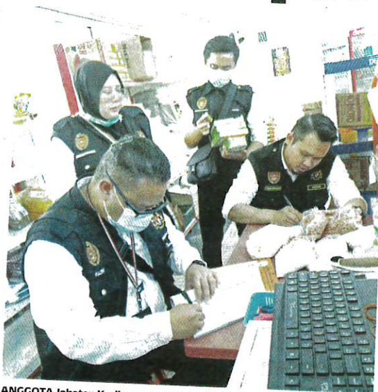
ANGGOTA Jabatan Kesihatan Negeri Melaka ketika sedang melakukan pemeriksaan menerusi Ops Tahun Baharu Cina 2023 baru-baru ini.

"Sehingga 19 Januari 2023, sebanyak 83 buah premis makanan iaitu restoren, gerai dan kedai makan telah diperiksa, manakala